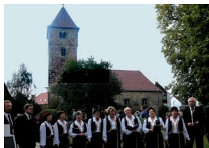
"Berjoska" übt jeden Mittwoch im Gemeindehaus und ist Markenzeichen für ganz Waldau geworden. Musikstudenten der Uni Kassel haben ein Projekt mit dieser Gruppe als Buch "Musik als Heimat" dokumentiert