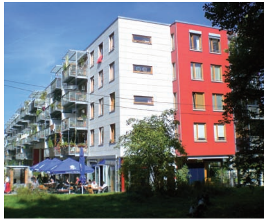
92 Wohnungen (67 Genossenschaftswohnungen, 25 Eigentumswohnungen), Nachbarschaftscafe, Bewohnertreff, Backshop, Gästezimmer, Ateliers, Büros u.a.