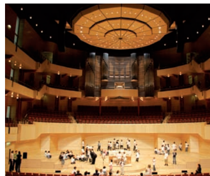
Besuch der Kinder in der Philharmonie Essen