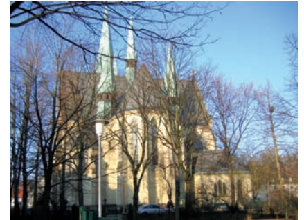
... auf dem Grundstück der evangelischen Kirchengemeinde