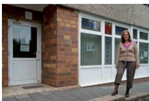
Im Erdgeschoss ist das Bürgerzentrum "Brücke" eingerichtet