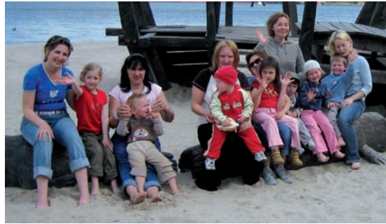
Projekt: Gesundheit und Kraft – für mich und mein Kind