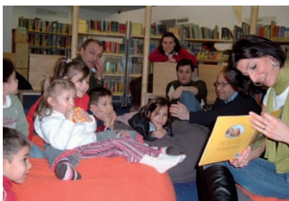
KiFa – Besuche in der Bibliothek mit den Elternkursen und den Eltern-Kind-Gruppen

Die Lernförderung im Elternhaus ist eine grundlegende Voraussetzung für den späteren Erfolg der Kinder in der Schule und im Beruf. Die Eltern sind die zentralen Vermittler für die Sprache der Kinder. Um sie aktiv in den Lernprozess ihrer Kinder einzubinden, verfolgt das Modell KiFa – Kinder- und Familienbildung einen ganzheitlichen Ansatz, der seit fünf Jahren erfolgreich funktioniert. Es richtet sich an sozial schwächere Familien, mit und ohne Migrationshintergrund, an benachteiligte Kinder, die bisher über kein Angebot erreicht werden konnten.