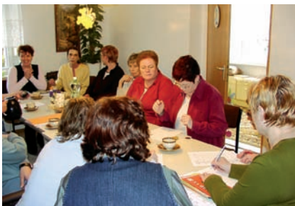
Die Mitarbeiter werden regelmäßig geschult