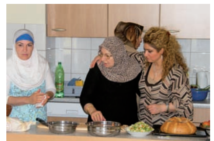
Türkische Küche – gemeinsames Kochen