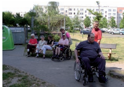
Das Konzept der Tagesbetreuung beinhaltet die sinnvolle Beschäftigung und Versorgung der Erkrankten und ist gleichzeitig Treffpunkt und Beratungsstelle: gegenwärtig gibt es 26 Tagesgäste, 16 werden zu Hause betreut