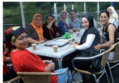
Vorbereitung einer eigenen Aktion: hier werden Erziehungsziele und Möglichkeiten im Maxipark besprochen

Die Lerninhalte beziehen sich auf Themen wie "Kindergesundheit", "Sprachentwicklungstests bei Vierjährigen" oder "Fördermöglichkeiten in der Familie". Anleitungen zu Förderspielen, Stadt- und Busfahrpläne zum Auffinden wichtiger Bildungs- und Freizeiteinrichtungen in Hamm oder Prospekte von Kulturveranstaltungen gehörten zu den Schulungsunterlagen der Teilnehmer. Während ihrer Ausbildung planten und erprobten die teilnehmenden Eltern eigene Aktionen für und mit ihren Landsleuten. Sie führten Gruppen von Müttern in den Maximilian- und Tierpark, auf den Spielplatz, in den Wald, in die Stadtbücherei u.a., um ihnen zu zeigen, welche Erlebnisse Ausflüge zu bieten haben. Oder sie stellten