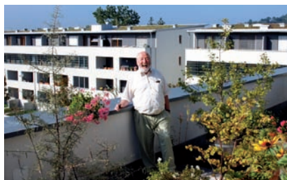
Mieter der Wohnbau Lörrach bewohnt eine Attikawohnung

Der in den 1990er Jahren erbaute Stadtteil Stetten Süd fand bei den Bewohnern des alten Ortskerns kaum Akzeptanz. Vorurteile gegen die mehrgeschossige Bebauung verstärkten sich vor allem dadurch, dass viele Spätaussiedler die ersten öffentlich geförderten Wohnungen eines privaten Investors bezogen. Verhaltensauffällige Jugendliche und mehrere Brandstiftungen taten ein Übriges und das Stigma war perfekt: Wohnungsanzeigen warben mit dem Zusatz "Nicht in Stetten Süd". Um den Stadtteil wieder sozial zu stabilisieren und als Wohnstandort attraktiv zu machen, verfolgte die städtische Wohnbaugesellschaft gemeinsam mit der Stadt einen integrierten Ansatz: