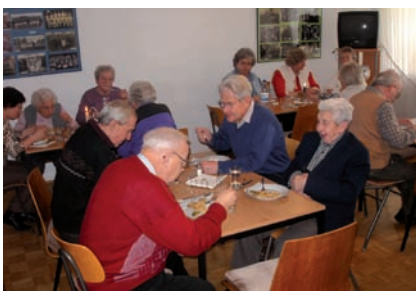
Ein Mittagessen im Treffpunkt Samowar kostet drei Euro