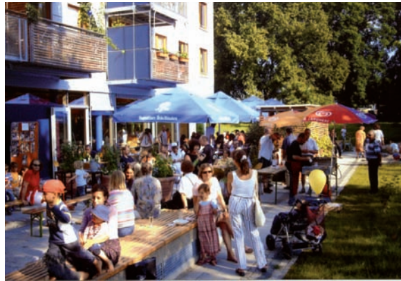
Cafe Rigoletto: Nachbarn und Freunde feiern gemeinsam, die Bewohner kennen sich und nehmen einander wahr

Gemeinsame Aktivitäten, Veranstaltungen und Feste bringen die Nachbarn einander näher