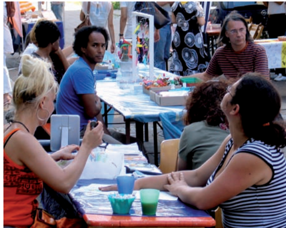
Das alljährliche Nachbarschaftsfest auf dem Jagenberggelände (2008)