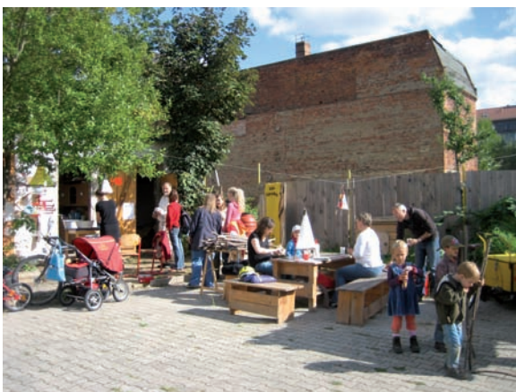
Der alljährliche Brachflächensalon vom Amt für Stadterneuerung fand 2007 auf den Flächen der Nachbarschaftsgärten statt: Laternen basteln, papuanisches Erdlochessen, Naturfarbenbilder u.a.