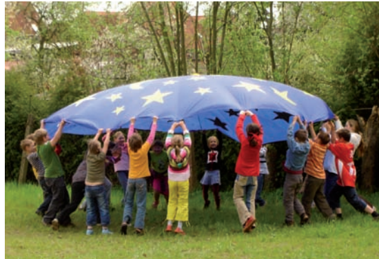
Projekt: Kind bleib gesund