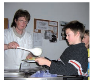
Projekt: Von satt zu gesund