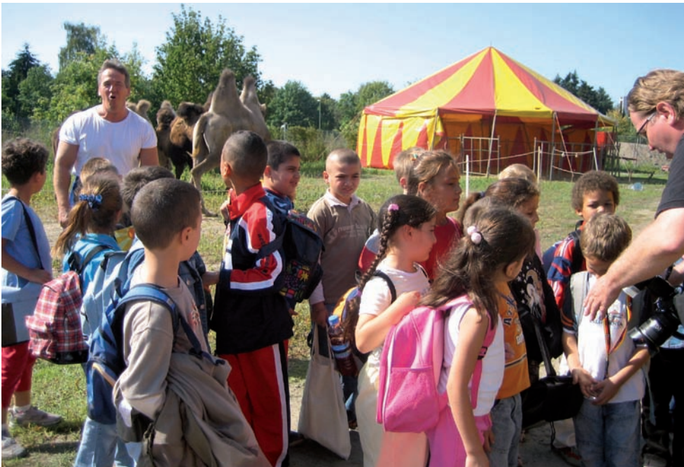
Der Zirkus Mondeo kooperiert mit Kindern aus über 45 Schulen

Ein Lernumfeld, das die Sinneswahrnehmung in vielfältiger Weise fördert