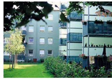
.. neue Innenhöfe. Vielfältige Wohnumfelder entstanden