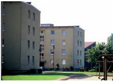
Im Stadtteil Vorfeld, Bausituation 1999 – vor der Sanierung