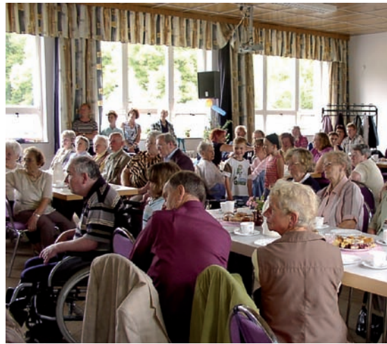
Jährlich findet ein Sommerfest (2008) statt