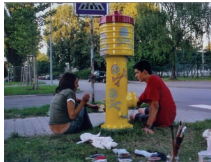
Jugendprojekt: Schöner Wohnen im Vorfeld, (EU-Förderprogramm: Lokales Kapital für soziale Zwecke), Bemalen von Hydranten und...