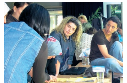
Theorievermittlung: Ausbildung der Multiplikatorinnen in Seminareinheiten; die Teilnehmerinnen und Teilnehmer wurden von unterschiedlichen Fachleuten ausgebildet