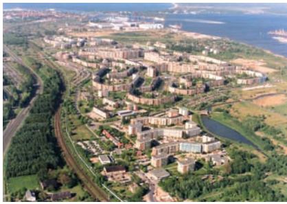
Stadtteil Groß Klein