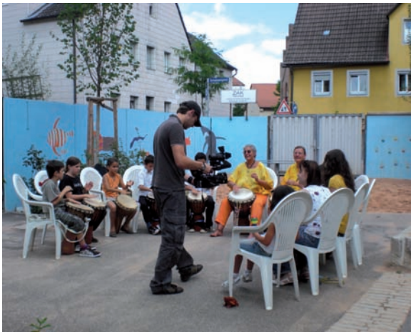
Die Trommelstunden mit zwei Tagesmüttern sind Kult im Schülerhaus. Bei schönem Wetter trommeln die Kinder gern auch im Garten - das klappt, weil die Nachbarn aus Griechenland kommen und es toll finden, wenn Kinder zusammen etwas unternehmen