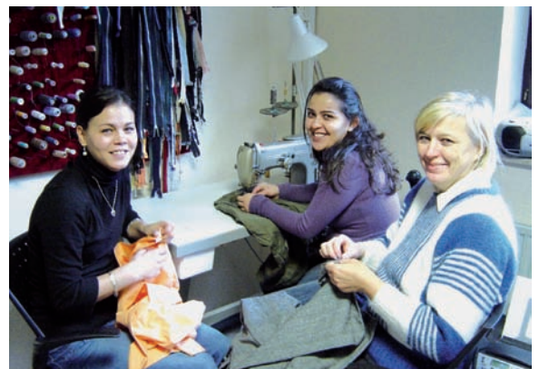
Für ein Integrations-Modellprojekt hat das Bundesamt für Migration und Flüchtlinge Nähmaschinen finanziert – nun lernen Frauen aus allen Ländern nebenbei Deutsch, während sie bei einer deutsch-türkischen Schneiderin nähen lernen