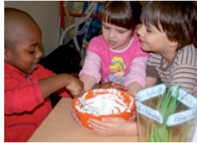
Projekt: Früh übt sich... auch gesunde Ernährung