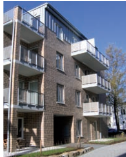
Neues Wohnprojekt mitten in der Stadt ...