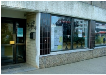
Das Stadtteilbüro in Stendal-Stadtsee ist im Erdgeschoss eines Wohnblocks untergebracht