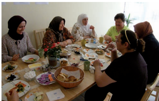
Die höchsten Teilnehmerzahlen konnten mit dem Frauenfrühstückstreffen erreicht werden. Hier kamen durchschnittlich 10 Personen jede Woche zusammen