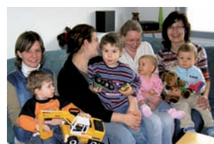
Mutter-Kind-Treffen: Privat organisierte Kinderkrippe

Die sozial verantwortungsvolle Umwandlung der "Konkursmasse" eines privaten Investors in ein dauerhaft nachgefragtes Wohnungsangebot, gepaart mit Engagement in der Gemeinwesenarbeit für den sozialen Zusammenhalt des Stadtteils als Ganzes, ist ein übertragbarer Beitrag der an einer nachhaltigen Vermietbarkeit ihrer Bestände orientierten Wohnungswirtschaft zur Sozialen Stadt.