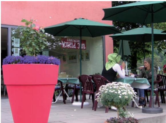
Das Stadtteilbüro 'Vorfeld Inn'