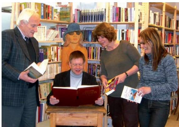
Einweihung des Bücherhauses: Der ZAK Verein lässt sich Bücher schenken, sortiert sie und gibt sie gegen Spenden weiter. Mit den Spenden wird das Haus der Bücher und das Schülerhaus finanziert