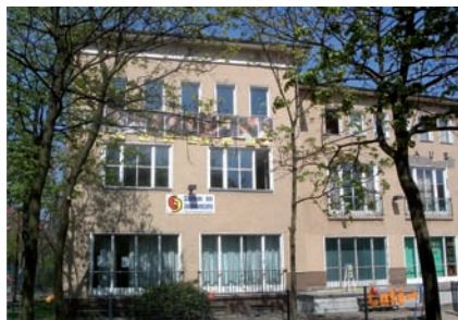
Haus der Jugend Mitte

Die Kenntnisse vieler Jugendlicher über die Strafbarkeit bestimmter Handlungen ebenso wie über das System der Strafverfolgung durch Polizei und Justiz sind nur sehr gering. Präventionsarbeit muss deshalb sowohl auf eine Änderung der Einstellung hinarbeiten als auch Kenntnisse über den Rechtsstaat vermitteln.