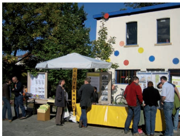
Juni 2005: Bau der Fahrradselbsthilfewerkstatt RAD-Haus