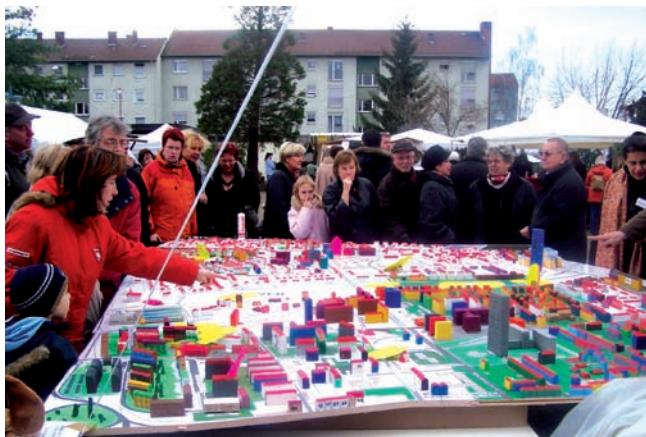
Maßstabsgetreu in Szene gesetzt und alle Maßnahmen auf einen Blick – Präsentation beim Adventsmarkt auf dem Berliner Platz am 9.12.2007

So wurden alle zu Gewinnern! Die Schüler konnten Theorie und Praxis verbinden, konnten ihre Lebenswelten nachvollziehbar darstellen. Gleichzeitig wurden die Bewohner und Bewohnerinnen, die im Quartier engagierten Träger und Verbände, aber auch die Kommunalpolitiker anschaulich am Beispiel des Stadtteils in den Planungsprozess eingebunden. Diese Symbiose in ihrer Beispielhaftigkeit und ihrem Modellcharakter hat die Jury überzeugt.