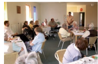
"Gemeinsam – statt einsam", Seniorenveranstaltung