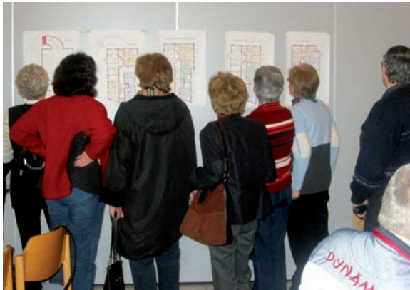
Vorstellung der Wohnungsgrundrisse