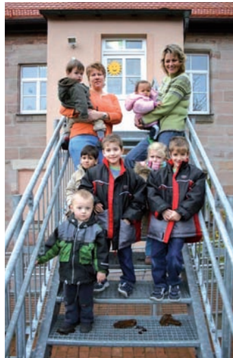
Eine Erzieherin und eine ausgebildete Tagesmutter teilen sich die Arbeit im Kindernebst. In den Ferien kommen zu den Kleinsten immer auch Kindergartenkinder dazu, deren Eltern keinen Urlaub bekommen. Die Kindernester des Vereins sind ganzjährig geöffnet