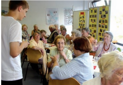
Das "Generationscafé" im Stadtteilbüro – Jugendliche unterstützen den Verein bei den Veranstaltungen