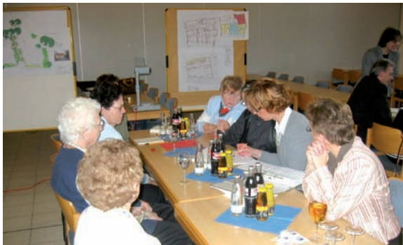
Gespräch mit Ansprechpartnern des Projektes in kleineren Diskussionsrunden