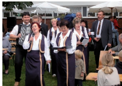
Musikgruppe "Berjoska" beim Gemeindefest der Kirchengemeinde