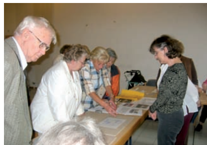
Diskussion über die Gestaltung des Gemeinschaftsraumes