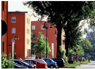
Veränderung in der Außenwahrnehmung: neue Straßenfassaden und ...