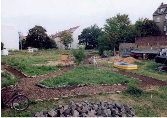
Grundstücke für die Nachbarschaftsgärten