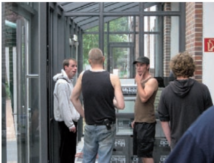
Gezielte Ansiedlung von Studierenden