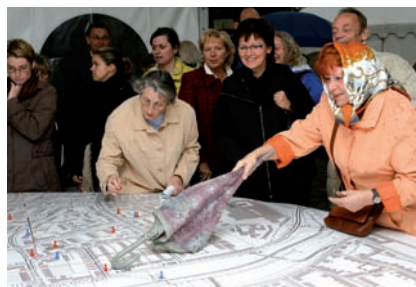
Bewohner orten ihr Zuhause