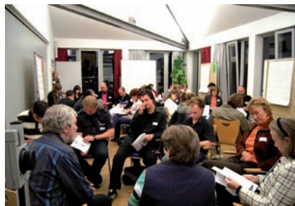
Workshop: Diskussion des Planungskonzeptes für die Aufwertung der Geschäftsstraße

Bundesweit zu beobachten ist der Trend der Verdrängung kleinerer Einzelhändler und Nahversorger in den Stadtteilen durch große Verbrauchermärkte. Diese überall spür- und sichtbare Entwicklung wird in sozial belasteten Quartieren wie Linden-Süd deutlich verstärkt durch die geringe Kaufkraft weiter Teile der Stadtteilbevölkerung. Die sinkenden Mietentnahmen wiederum bremsen dringend notwendige Modernisierungsarbeiten an den Häusern.