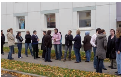
Teilnehmerinnen des Elternkurses; im Erdgeschoss des Wohngebäudes finden die Bildungs- und Beratungsangebote statt