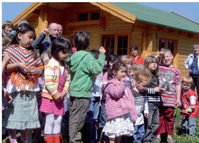
Kinder, Eltern und Senioren feiern vor der neuen Hütte Richtfest in den "Bunten Gärten"

Praktische Tätigkeiten im Alltag sind ein hilfreiches Bindeglied zwischen Kulturen und Generationen. Vor diesem Hintergrund sind in den letzten Jahren bereits in vielen Städten gemeinschaftliche Garten-Projekte angestoßen worden. Das Besondere an den "Familiengärten" in Essen-Katernberg ist das breite Spektrum an fleißigen Gärtnern: Kinder, Erzieher und Eltern aus zwei Kindertagesstätten bearbeiten gemeinsam die 300 qm große Parzelle in einer in der Nähe entstehenden, interkulturellen Kleingartenanlage. Auch die Gäste einer Seniorentagesstätte sind in das Geschehen eingebunden. In den Familiengärten schaffen sich Kinder und Eltern aus unterschiedlichen Kulturkreisen ein neues Stück "Katernberger Heimat"; zugleich erfolgt mit dem Projekt der Brückenschlag zu den Älteren. Die Jury wünscht sich "Nachahmer" für diesen innovativen Ansatz.