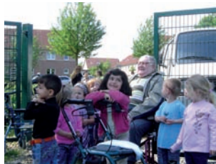
Viele der Senioren aus dem anliegenden Luise-Schröder-Sozialzentrum hatten selber Gärten und können den Kindern eine Menge beibringen