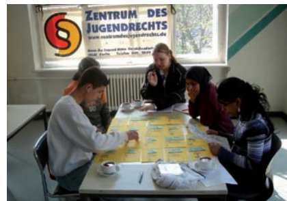
Fallbeispiele aus dem Alltag werden durchgespielt: Wo geht's, wo nicht?

Gewürdigt wird, dass es ausgehend von dem Engagement Einzelner gelungen ist, ein Netzwerk von Beteiligten aufzubauen, das in einem simulierten Echtbetrieb von der Entstehung einer Straftat bis hin zur Verurteilung besonders geeignet ist, kriminalitätsgefährdete Kinder und Jugendliche präventiv vor der Begehung einer Straftat abzuschrecken. Hervorzuheben ist, dass der Einsatz bei besonders gefährdeten Kindern und Jugendlichen im Rahmen von Schulprojektwochen erfolgt. Besonders wirksam ist, dass die Projektwochen an tatsächlichen Handlungsorten – auf der Polizeiwache, im Gerichtssaal, im Gefängnis – stattfinden. Aus Sicht der Jury ist dieser Handlungsansatz modellhaft und übertragbar.