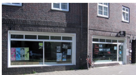
Café UNMUT – die GWG stellt den Studenten einen eigenen Treffpunkt kostenlos zur Verfügung