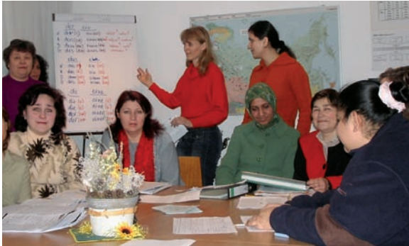
Sprachkurs im Treffpunkt Samowar