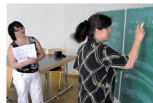
Sprachkurs im Zentrum für Spielen und Gestalten: Ich lerne deutsch