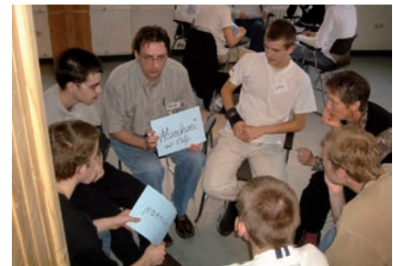
Auswertung und Ergebnissicherung