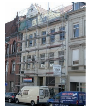
Fassadensanierung, Förderprogramm "Wir bezahlen Ihr Gerüst"