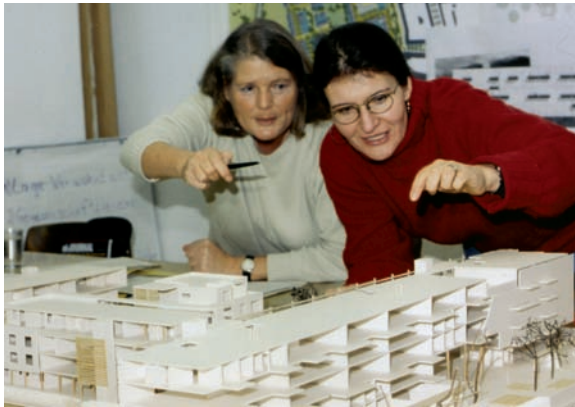
Beteiligung in der Planungs- und Bauphase, Diskussion am Modell