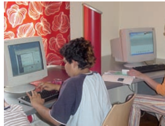
Internet Cafe im 'Vorfeld Inn' – "PC-Erste Schritte und mehr"