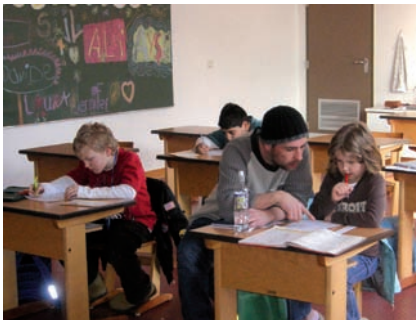
Projekt Stadtteilbüro in der Grundschule Vorfeld, Hausaufgabenbetreuung