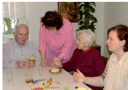
Ehrenamtliche Mitarbeiter kümmern sich liebevoll um die Erkrankten in der Tagesstätte für Demenzerkrankte