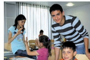
Jugendliche der Realschule betreuen Grundschüler mit Migrationshintergrund