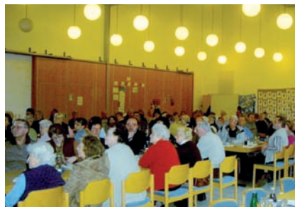
Die Wohnungsbaugenossenschaft Lünen informiert über neue Wohnangebote, Auftaktveranstaltung