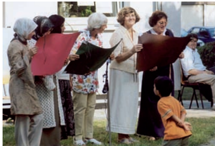
Sprachkursteilnehmer beim Sommerfest