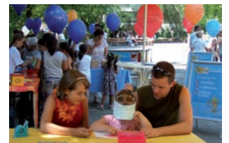
KiFa – Aktionen für Kinder / Öffentlichkeitsarbeit

Das Projekt reagiert auf die niedrige Bildungsbeteiligung in Soziale Stadt-Gebieten, indem es an der richtigen Stelle ansetzt. Systematische Elternbildung ist der Schlüssel für eine erfolgreiche Bildungslaufbahn der Kinder. Ein breites Bündnis von lokalen und überörtlichen Partnern betreibt das Projekt modellhaft, um es in der Folge systematisch auf die ganze Stadt auszuweiten. Dies ist einer der seltenen Fälle von erfolgreicher Übertragung eines Modells in die Regelstrukturen. Durch frühzeitige Einbindung überörtlich wirkender Akteure gibt es gute Chancen des Transfers über die Stadtgrenzen hinaus.