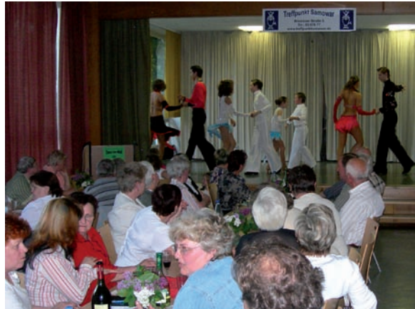
Begegnungstreffen "Tanz im Mai" im Evangelischen Gemeindehaus 2008