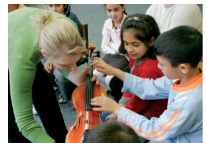
Die Kinder lernen beim Begegnungstag Instrumente kennen