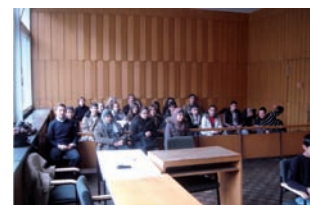
Rollenspiel: Gerichtsverhandlung im Amtsgericht Tiergarten