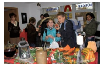
Halloween-Party in Kooperation mit "Heim und Garten" und der "Brückenapotheke"