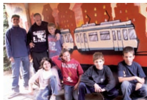
Teilnehmer des Graffiti-Projektes

Das Projekt verbindet eine Vielzahl von Aktivitäten in einem Wohnquartier, das in den letzten Jahren einem schwierigen sozialen Wandel unterworfen war, um durch den Aufbau eines umfassenden sozialen Netzes das nachbarschaftliche Miteinander zu stärken. Alle Generationen, einheimische und zugewanderte Bewohner, sind angesprochen und wirken mit.