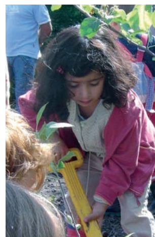
Kinder gestalten ihren Garten