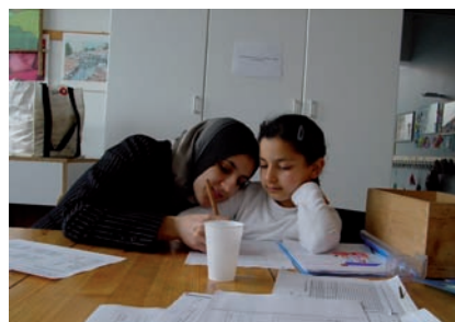
Sprachförderung im Salzmannbau