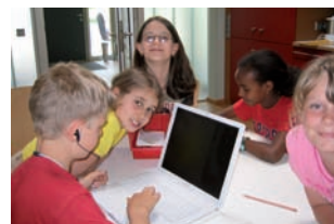
Kids machen Zeitung: Kinder verfassen einen Aktionsbericht mit Bildern für die Kundenzeitung der Wohnbau Lörrach