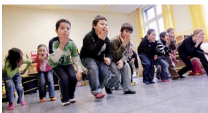
Kinder lernen spielend Bewegung, Rhythmus, Stimme und Musik zu verbinden