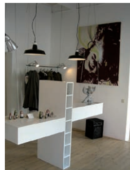
Entwicklung des Branchenschwerpunktes "Modedesign", Ansiedlung von ExistenzgründerInnen, Existenzgründerberatung