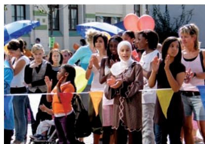
Aufführung der Tanzgruppe