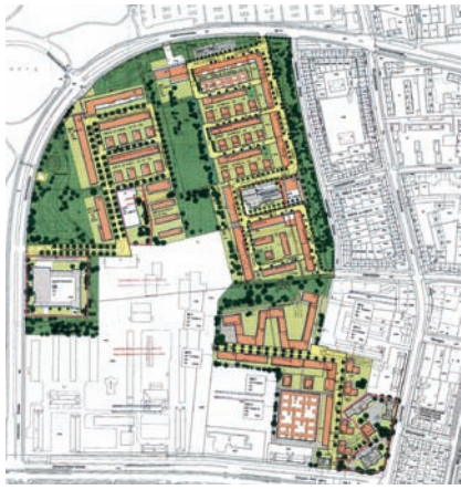
Lageplan Ackermannbogen 1.BA