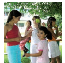
Kinderbetreuung wurde organisiert, damit die Mütter ungestört Deutsch lernen können