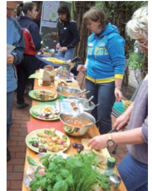
Projekt: Familien – Gesundheitsmarkt