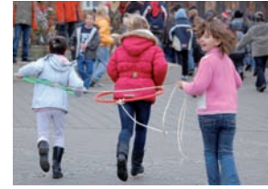
Projekt: Bewegte Hofpause