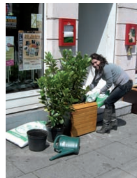
Begrünungsmaßnahmen, Müllbeseitigung, Ausweitung der Außen-gastronomie