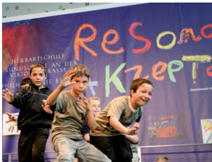
Die Aufführung bildet als Abschluss der einjährigen Projektphase einen besonderen Höhepunkt für die Kinder