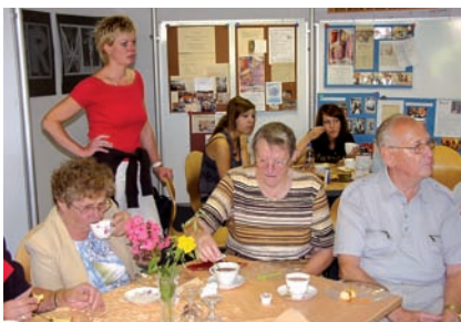
1x im Monat finden im Generationscafé Themenveranstaltungen statt