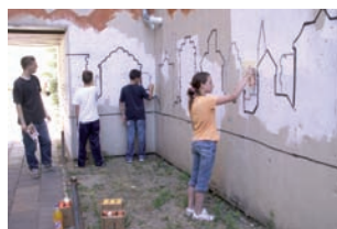
Graffiti- Projekt 2008 – eine Kooperation zwischen Wohnungsbaugenossenschaft Rüdersdorf, "Brücke" und Kolonne-Ost, Werbeagentur

Das Bürgerzentrum "Brücke" befindet sich in einem in den 1970er Jahren erbauten Plattenbaugelände. Es wurde für Bewohner errichtet, die infolge der Erweiterung des Tagesbaus (Kalkabbau) umgesiedelt werden mussten. Bewohner in wirtschaftlich guter Lage zogen nach 1990 in Wohneigentum. Die freigewordenen Wohnungen wurden im Laufe der Jahre von sozial schwächeren Bewohnern, Alleinerziehenden und Familien, Russlanddeutschen und Migranten bezogen. Arbeitslosigkeit, Suchtprobleme, Vandalismus und Rechtsradikalismus verschärften die Konflikte im Quartier – eine soziale Abkoppelung vom übrigen Ort droht.