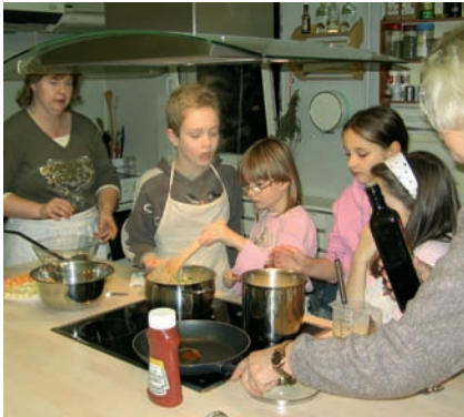
Projekt: Kinder lernen gesundes Kochen