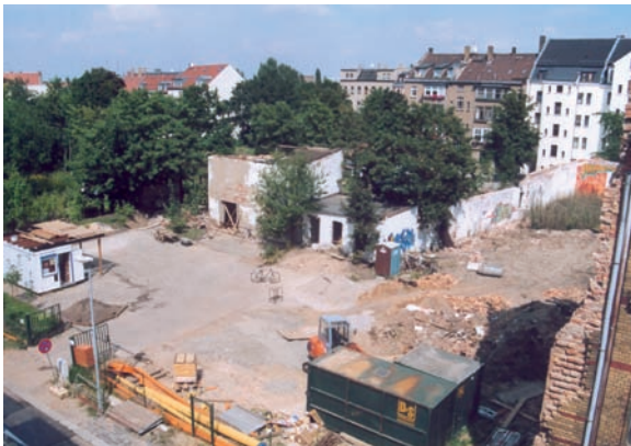
Staubige Abrisswüste: Die Nachbarschaftsgärten zu Projektbeginn 2004 – an der Stelle des Fahrrades in der Bildmitte wurden im Herbst 2007 die Gartenlaternen zum Brachflächentag gebastelt (siehe Bild unten)