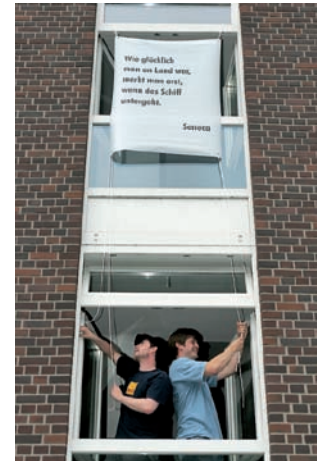
Poesie der Straße