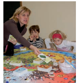
Projekt: PowerKauer – Fit durch den Tag

Neue Verbraucherzentrale in Mecklenburg und Vorpommern e.V. Volkssolidarität Kreisverband Rostock-Stadt e.V., Stadtteil- und Begegnungszentrum Dierkow Fischkutter Jugend- und Begegnungsstätte e.V. Soziale Dienste von Oertzen GmbH / Kita "Spatzennest" Landesverband Mecklenburg-Vorpommern e.V. IGA Rostock 2003 GmbH AWO-Sozialdienst Rostock gGmbH / Kita "Kinderhaus am Warnopark" Rostocker Stadtmission e.V. / Kita "Regenbogen" Charisma e.V. Verein für Frauen und Familie Gemeinsam für Groß und Klein e.V. Praxis für Physiotherapie & med. Fitness Schulverein einer Grundschule Diakonieverein im Kirchenkreis Rostock, Rostocker Stadtmission Deutsches Rotes Kreuz Kreisverband Rostock e.V. / Kita "Steppkeland" RGS-Projektassistenz SoS RGS-Stadtteilbüro Groß Klein