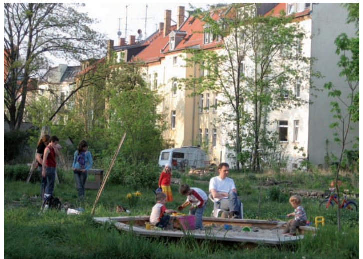
Seit 2005 ziehen Familien in die Nähe "ihres" Gartens