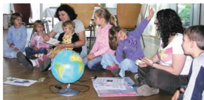
Interkulturelles Lernen: "Reise um die Welt" – Kennenlernen der Herkunftsländer