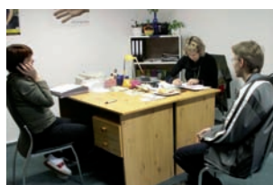
Berufsfindungsberatung für Jugendliche