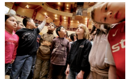
Präsentation der großen Kuhn-Organ in der Philharmonie Essen