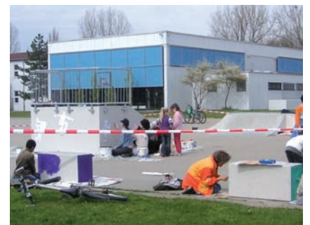
...bemalen von Elementen der Skaterbahn