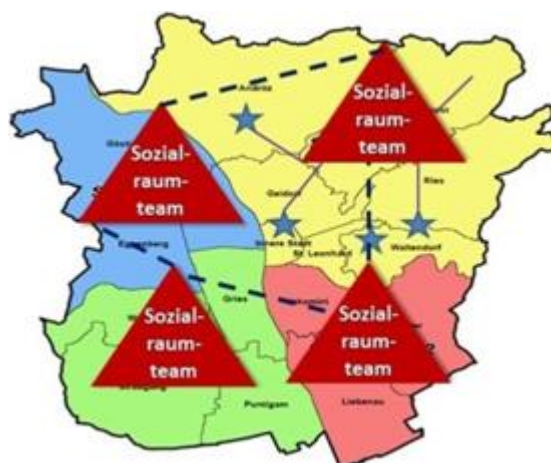
Abb. 2 Interterritorialer Ressourcentransfer

Der Vortrag befasst sich mit der Frage nach den Optionen Transaktionskosten (Williamson 1990) günstiger Ressourcentransfers durch interterritoriale Netzwerkstrukturen in sozialraumorientierten Kinder- und Jugendhilfesystemen. Der Netzwerkbegriff wird sowohl für Sozialraumteams 1 als auch für sozialraumteam-übergreifende interterritoriale Ressourcentransfers 2 verwendet. Der Vortrag basiert auf einer von der Hans-Böckler-Stiftung geförderten Studie. Die bis zur Durchführung der Studie unbekannt, interterritorialen Netzwerkstrukturen wurden ausgehend von dem bestehenden interorganisatorischen Netzwerk Sozialraumteam- in dem die mit einer quantitativen und qualitativen ego-zentrierten Netzwerkanalyse befragten Fachkräfte arbeiten- beforcht. Sozialraumteam-Mitarbeiter übernehmen in einem administrativ definierten, territorialen Planungsraum (i. d. R. ein Stadtteil bzw. eine ländliche Gemeinde) fallspezifische, fallunspezifische sowie fallübergreifende Verantwortung.