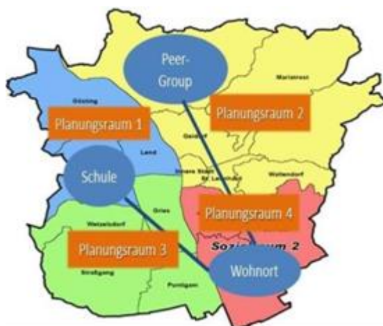
Abb. 1 Örtlich verinselte Lebenswelt