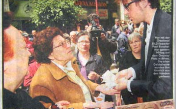
BILD gibt den Pleite-Griechen die DRACHMEN zurück

Alten - Das Bild... Drachmen in der Hand... endlich wieder... und spinnen... Schein... Hellen... Schein... Hellen...