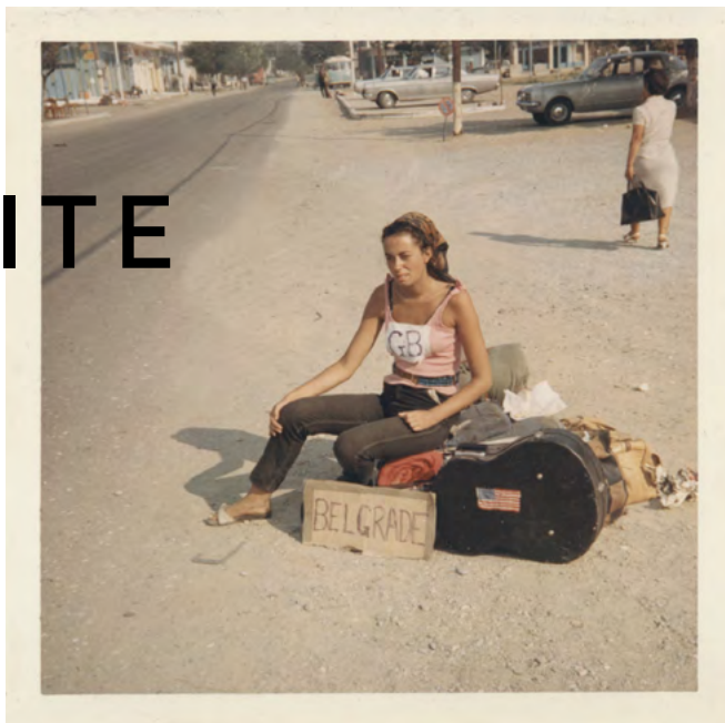
An der Grenze von Griechenland nach Jugoslawien 1969

Mahatma Gandhi, Nelson Mandela und die Schriftsteller George Orwell und Albert Camus haben mich sicherlich als Teenager sehr beeindruckt. Alles Männer. Das hat sich ganz sicherlich geändert! Eine Frau aber gab es schon damals, die mich besonders faszinierte, Joan Baez: durch ihre wunderbare Stimme, aber vor allem durch ihr standfestes Engagement für die Bürgerrechtsbewegung. Zu dieser Zeit war für mich die Anti-Apartheid-Bewegung von großer Bedeutung. Wichtiger als die „Idole“ war aber das Erfahrungswissen aus der Arbeitswelt, das ich in diesem jungen Alter sammeln konnte. Ich machte eine Hotelschulausbildung. Sie dauerte lediglich sechs intensive Wintermonate, bevor ich dann zwei Jahre lang in unterschiedlichen Positionen und Orten im Hotelfach arbeitete. Sehr schnell musste ich Verantwortung übernehmen, insbesondere als Hausdame in einem angesehenen großen Hotel.