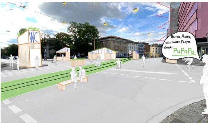
Beispielhafte Umgestaltung des Willy-Brandt-Platzes in Darmstadt

Wir befinden uns im Jahr 2026. Die Innenstädte wandeln sich. Die Verkehrswende ist fortgeschritten. Die entstehenden Freiflächen sollen belebt und gestaltet werden. Die zurückliegende Corona-Pandemie hat die Bedeutung der öffentlichen Räume als soziale (Begegnungs-)Räume verdeutlicht, die sowohl als Ort der Gemeinschaft wie auch als persönliche Rückzugsorte dienen sollen. Das Ziel von PU(PA) 2 _ ist die temporäre Gestaltung freier Flächen, um nachhaltige Perspektiven zur Nutzung öffentlicher Räume aufzuzeigen und flexibel angepasst an die konkreten Anforderungen spezifischer Orte zu verwirklichen. Der Pop up-Charakter des Projektes ist das innovative Moment, welches eine flexible Struktur ermöglicht, in der zunächst unbestimmten Nutzer:innengruppen begegnet werden kann. Im Verlauf der etwa sechs-monatigen Projekte kann und soll die Ausgestaltung an die sich herauskristallisierenden Bedürfnisse angepasst werden.