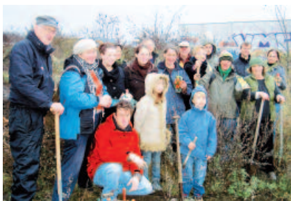
Aktion „Mülheim blüht“: Auf der Industrietrache „Alter Güterbahnhof“ werden Blumenzwiebeln gepflanzt. Blumen sollen blühen und ein neues Stadtquartier.