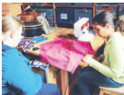
Praxistag im Bereich Hauswirtschaft, Kostümfundus