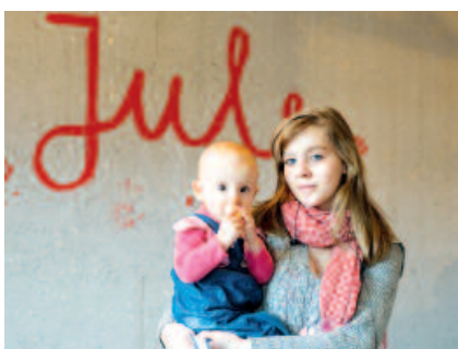
Die 18-Jährige will ihr Abitur ablegen und Sozialpädagogin werden. „Jule“ hilft ihr dabei.