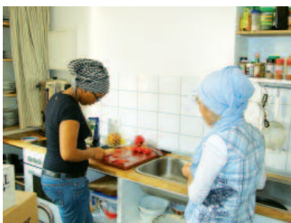
Praxistag im Bereich Hauswirtschaft, Küche