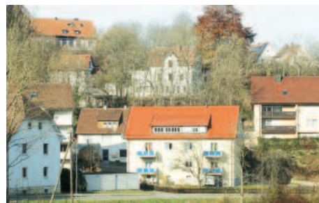
Das Haus fügt sich in die Nachbarschaft ein und wird von den Anwohnern akzeptiert.