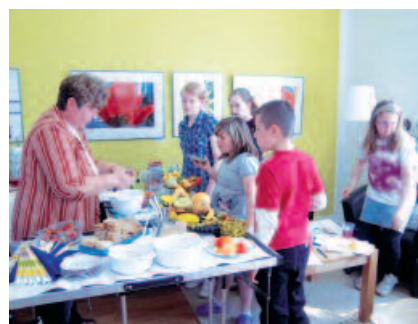
Ernährungsberatung für Kinder