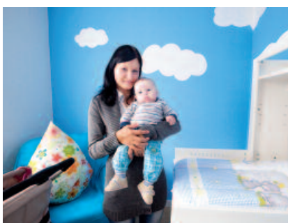
Lichtblick für Alleinerziehende: 15 Wohnungen stellt die degwo den jun- gen Müttern und Vätern zur Verfügung.