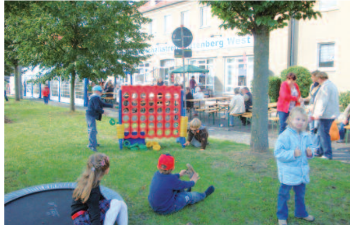
Freizeit-, Bildungs- und Teilhabeangebote sowie ehrenamtliche Nachbarschaftshilfen stärken die Identifikation mit dem Gebiet.