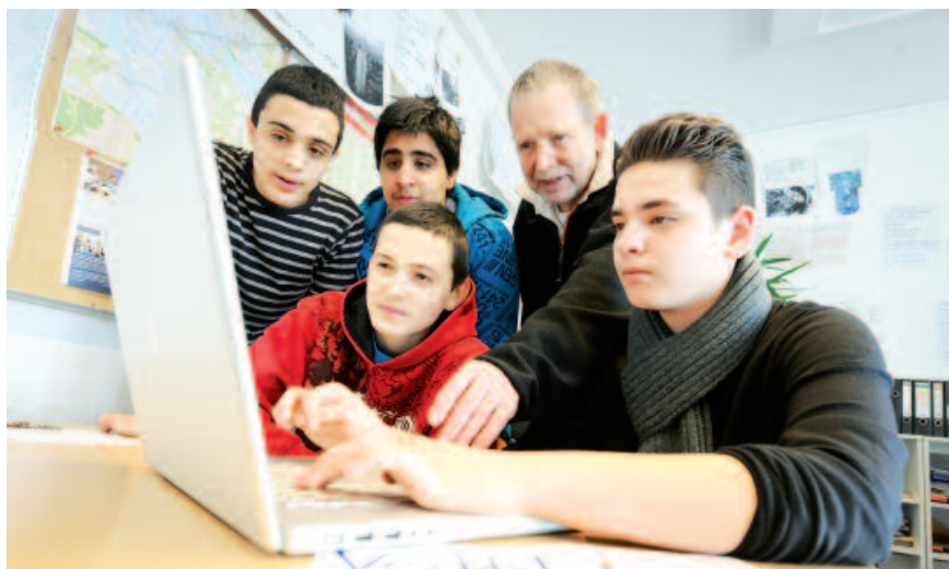
Kommunikationstraining, eine spezielle Buchhaltungsfortbildung, eine grafische Weiterbildung und auch eine sportliche Qualifizierung sind erforderlich, um den Anforderungen der Schülerfirma gerecht zu werden.