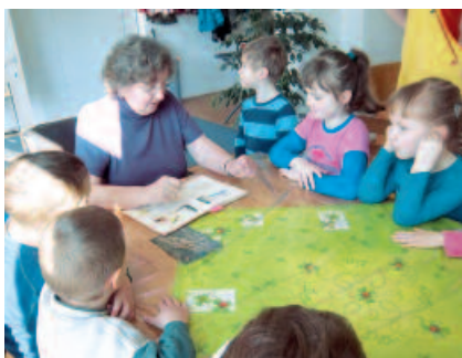
Lern- und Lesepatzen