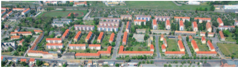
Das Konzept der energetischen Sanierung soll bis 2016 umgesetzt werden.