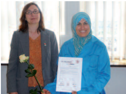
Teilnehmer der „Qualifizierung Helfende Hände“ erhalten durch die Stadträtin Dr. Kerstin Weinbach die Urkunde.

Im Zuge der demografischen Veränderungen steigt auch in Haushalten mit Migrationshintergrund der Bedarf an haushaltsnahen Dienstleistungen und Pflege. Dieser Bedarf kann mit den im Stadtteil vorhandenen Strukturen nicht immer gedeckt werden. Es fehlt an Personal mit entsprechenden Sprachkenntnissen. Auch die unterschiedlichen kulturellen Bedürfnisse finden wenig Beachtung. Auf der anderen Seite sind auch die Migranten von fehlender Ausbildung und von Arbeitslosigkeit betroffen. Die „Helfenden Hände am Berg“ kümmern sich um Einkäufe, unterstützen beim Arztbesuch, helfen im Haushalt und auch beim Anziehen und Essen. Sie leisten auch Gesellschaft, lesen vor oder gehen auf Wunsch mit spazieren. Damit werden nicht nur die Älteren und Hilfebedürftigen unterstützt, sondern auch deren Familien.