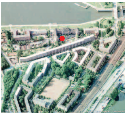
Junges Viertel mit vielen Kindern und Jugendlichen