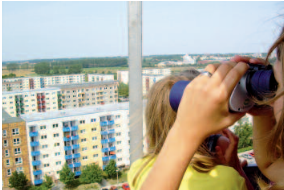
Blick auf das Wohngebiet Grünhufe