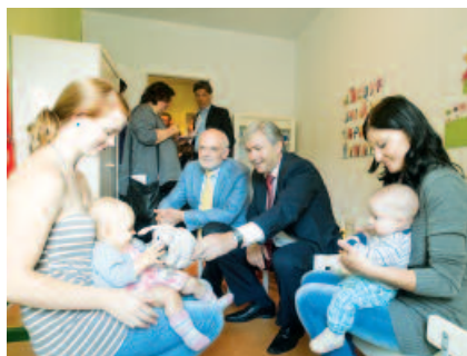
Berlins Regierender Bürgermeister Klaus Wowereit kam zur Schlüsselübergabe im Sommer 2012.