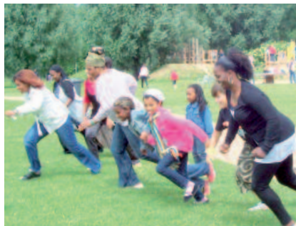
Das Projekt 'Interkulturelle Kompetenzen im Kindergarten' trägt zur Behebung von Kommunikationsproblemen zwischen Eltern und Erziehern bei.