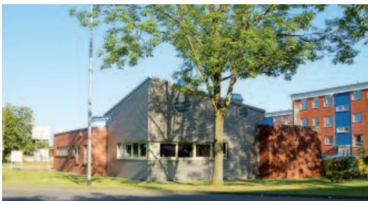
Im Vordergrund: Neubau, in dem die Qualifizierungsküche untergebracht ist. Im Hintergrund ist das Stadtteilhaus mit Bistro zu sehen.

Das Altländer Viertel entstand Ende der 1960er Jahre als Vorzeigeprojekt für modernes und zeitgemäßes Wohnen. Nach dem Konkurs des Wohnungsbauunternehmens 'Neue Heimat', der Zersplitterung in Einzeligentum und damit verbundener Wohnraumspekulation geriet das soziale Gefüge aus dem Gleichgewicht. Seit 2000 wird das Quartier durch das Programm 'Soziale Stadt' unterstützt.