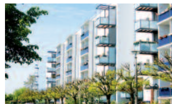
Hellersdorf bietet für jeden Mieterwunsch attraktive Angebote in vielfältiger Architektur.