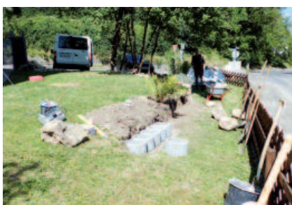
Die zeitweiligen Bewohner wirken bei der Gestaltung des Wohnumfeldes mit.