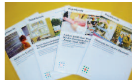
Dokumentationen der Praxis-Beispiele