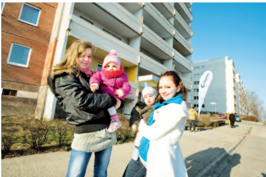
Bezahlbare Wohnungen: Berlins größte WG für Alleinerziehende