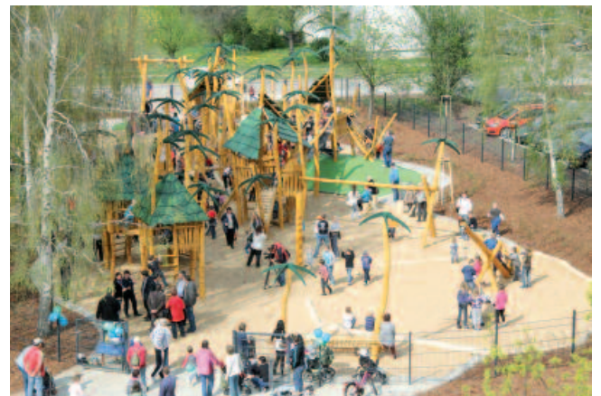
Der intensiv genutzte Dschungelspielplatz bietet eine wunderbare Plattform der Kommunikation und des Kennenlernens.

Die Jury würdigt das Engagement des kommunalen Wohnungsunternehmens, mit weiteren Partnern für Kinder im Wohngebiet vielfältige Betreuungsangebote zu schaffen. Der Gedanke basiert auf den Ideen von Albert Schweitzer, Familien zu begleiten, zu begeistern, zu fordern und zu fördern, denn die Jüngsten bleiben in sozial benachteiligten Quartieren meist auf der Strecke. Überzeugend ist die Einbeziehung der Eltern in den Planungs- und Gestaltungsprozess. Dies ist auch ein Grund für die hohe Akzeptanz der Maßnahmen.