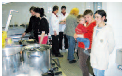
Projekt „Schritte zu gelingender Elternschaft“; Treffen mit anderen Müttern und Vätern, hier bei einem Kochevent.