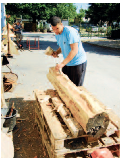
Praxistag im Bereich Bildhauerwerkstatt – Beitrag zum Hauptschulabschluss