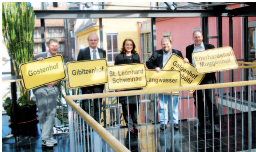
Neue Paten gesucht: Drei Stadtteile warten noch auf einen engagierten Förderer.

Unternehmen als Paten für die Stadtentwicklung zu gewinnen, ist ein bemerkenswerter Ansatz. Dies gerade deshalb, weil unternehmerisches Sponsoring sich im Regelfall nur auf Einzelprojekte beschränkt. Wenn durch die neuen Patenschaften für ganze Stadtteile wieder eine Identifikation zwischen Unternehmen und Bewohnern erreicht werden kann, dann wird dieses Modell als erstrebenswerter Beitrag zur Nachahmung empfohlen.