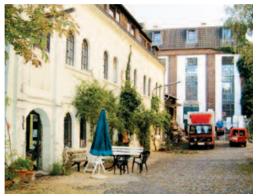
Wohngebäude des Vereins: Ein altes Fabrikgebäude wurde in Eigeninitiative umgebaut.