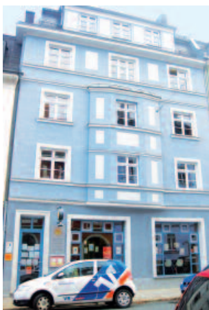
Jugendhilfe- und Mehrgenerationenhaus

Gründerzeitliches, innenstadtnahes Wohnviertel