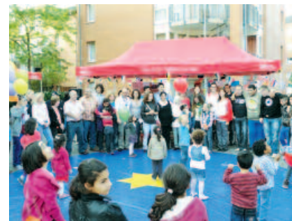
Gut organisierte Stadtteilstefen stärken die Nachbarschaften.