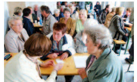
'Mieterwerkstatt' zur Quartiersentwicklung