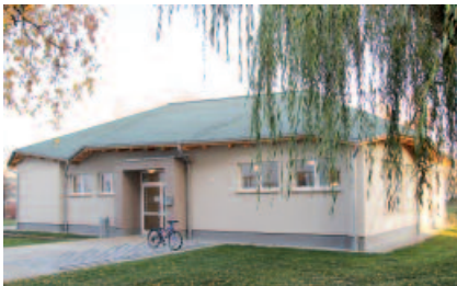
Der ehemalige Wäschestützpunkt wurde zum Kindertreff umgebaut.