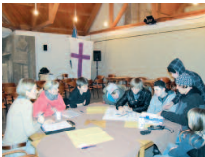
Kinder planen die Gestaltung ihres Biker-Platzes.