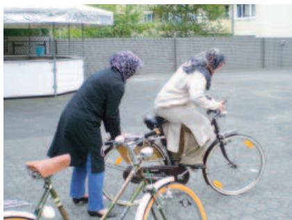
Fahrradkurse für muslimische Frauen: Die Frauen werden mobiler und selbstbewusster und verbessern nebenbei ihre Deutschkenntnisse.