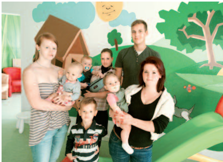
Neun Mütter und ein Vater wohnen seit Sommer 2012 in den von der degwo bereitgestellten Wohnungen. Sie haben sich einen Kita-Platz organisiert, holen einen Schulabschluss nach oder haben eine Berufsaus- bildung begonnen (Stand Dezember 2012).