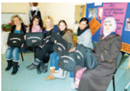
Die Stadtteilmütter sind Unterstützerinnen und Brückenbauerinnen bei der alltäglichen Integration.