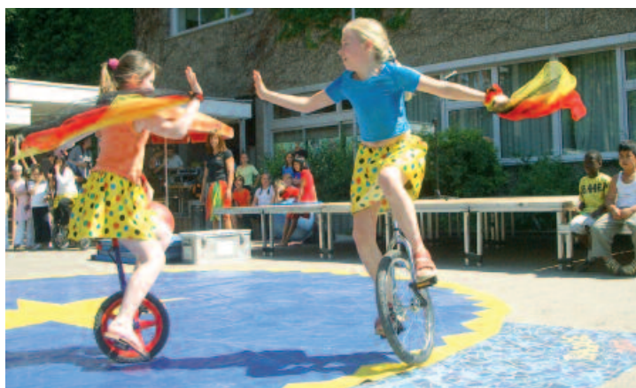
Auftritt auf dem Stadtteilstfest: Mit Selbstvertrauen und Mut gelingen Balanceakte auf hohem Niveau.