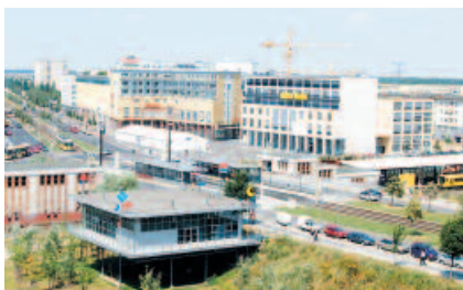
Im 'BAUKASTEN' (im Bildvordergrund) hat die Wohntheke seit ihrer Gründung im Juni 2000 ihre Anlaufstelle.