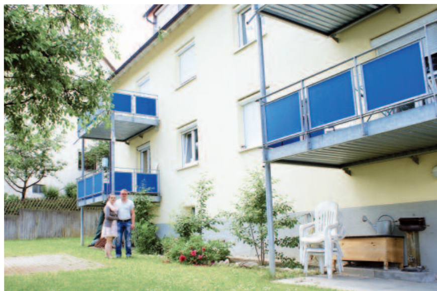
Schon während der Modernisierungsmaßnahme des Gebäudes beschloss die Landes-Baugenossenschaft Württemberg eG, das Haus und die Wohnungen an den Fachverband AGJ zu vermieten.