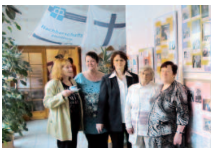
Spätaussiedler und Deutsche schreiben ihre Lebensgeschichten auf und vergleichen die Lebensläufe.