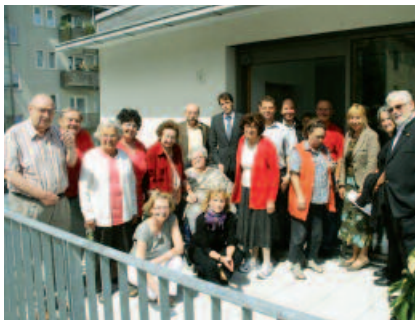
Neumieter und Mitarbeiter der Genossenschaft bei der Eröffnung des Nachbarschaftstreffs 'Barthblock' (2011). 'Wohnen in der Gemeinschaft': Neubau von neun barrierefreien Wohnungen und gemeinschaftlicher Terrasse im Dachgeschoss.

Das Miteinander aller Generationen und hilfreiche Solidarität, wie bei der Gründung der Genossenschaft vor 101 Jahren, wurden hier wiederbelebt, klug organisiert und weiterentwickelt. Ein nachahmenswertes Beispiel für viele „alte“ Genossenschaften, auch weil sich die Aktivitäten nicht auf die Mitglieder beschränken, sondern das ganze Quartier in den Blick nehmen.