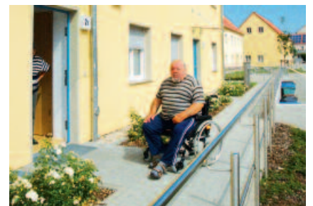
Konzept der WBG: Jede durch Mieterwechsel freiwerdende Erdgeschosswohnung wird seniorengerecht umgebaut und zunächst den übrigen Nutzern des Hauseingangs zum Umzug angeboten.