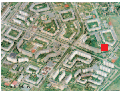
Ausschnitt aus der Wohnstadt Marzahn: Standort des Projektes