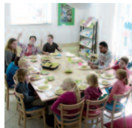
Ferienprogramm 2010, Mittagessen im Nachbarschaftstreff Tulbeckstraße