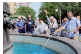
Kunstaktion "Kopf oder Zahl", Teilnehmer der Werkstatt warfen Münzen in den Brunnen am Platz und verwandelten ihn in einen öffentlichen Raum für Wünsche, Chancen und Perspektiven für das Quartier.

Der ausgelöste Prozess ist unumkehrbar und hat das Miteinander am Mehringplatz nachhaltig verändert. Wie dies gelungen ist, ist so schlicht wie überzeugend und daher zur Nachahmung dringend empfohlen. Dieses Engagement regt dazu an, dass auch andere Stadtteile sich auf diese Reise begeben und die Früchte einer gemeinsamen Vision von der Zukunft ihres Stadtteils ernten.