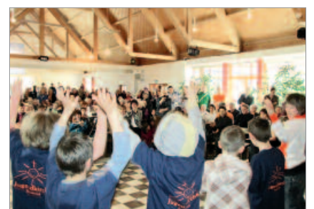
Gottesdienste werden manchmal zu Stadtteilstesten.