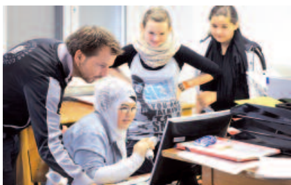
Verwaltung von Einnahmen und Ausgaben, Abrechnungen mit dem Eigentümer werden unter Anleitung erlernt.