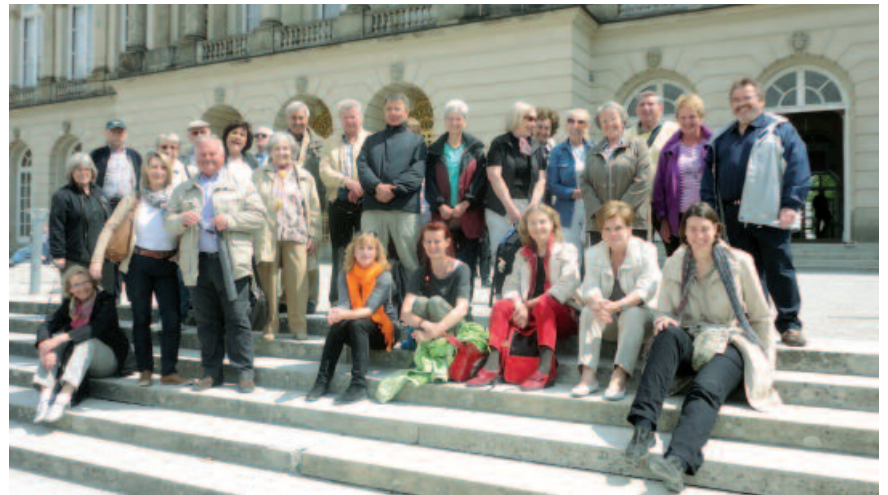
Das Projekt wird in seiner Vielfalt der Angebote durch derzeit ca. 50 bis 60 aktive Ehrenamtliche getragen. Begleitet werden diese durch ein sozialpädagogisches Fachpersonal.