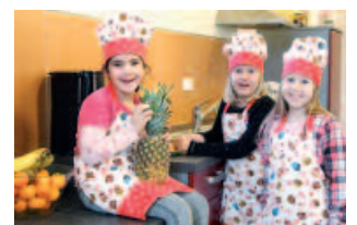
Kochen im Kindertreff