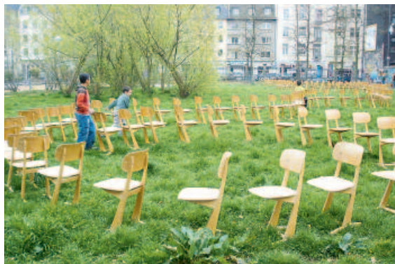
Mit einer Kunstaktion wurde auf die vermüllte Parkanlage aufmerksam gemacht. Bei der Bürgerinitiative „Nachbarschaft Mülheim-Nord“ sind nach dieser Aktion mehr Bewohner bereit sich im Wohnquartier zu engagieren.