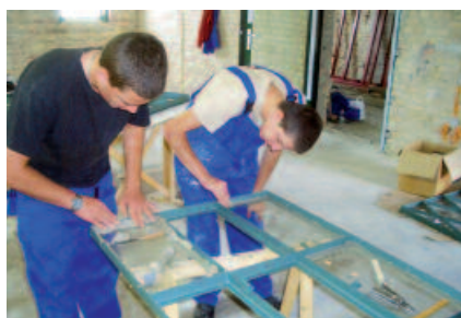
Pilotprojekt Qualifizierung unter realitätsnahen Bedingungen