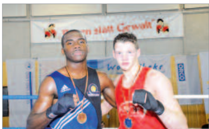
Box-Pokal der Hellersdorfer Wohntheke: 'Boxen statt Gewalt' (2005)