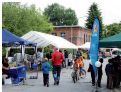
Neuer Treffpunkt im Quartier

In mustergültiger Weise wurden mit dem Umbau eines alten Trafohauses in Bischofsheim Mehreres gleichzeitig erreicht: Der Stadtteil bekam ein Quartiers- und Vereinszentrum in einer historisch wertvollen Liegenschaft. Bildungsbenachteiligte Jugendliche haben die Bauarbeiten gestemmt und wurden qualifiziert. Die Identifikation und das Engagement vieler Bewohner aus dem Stadtteil für den Treffpunkt ist gesichert. Ein Projekt, das aus Sicht der Jury Nachahmer haben sollte.