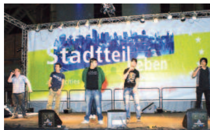
Kultureller Abschluss der Fachkonferenz