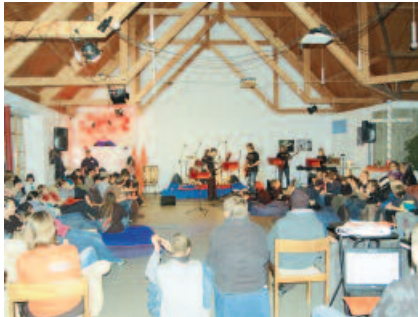
Jugendveranstaltung im Nachbarschaftszentrum der Auferstehungskirche