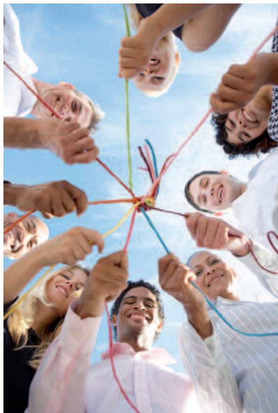
Vernetzung der Akteure im Stadtteil