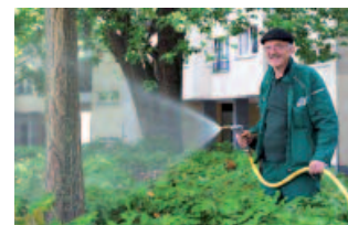
Der Platzgärtner wird finanziert durch GEWOBAG, Bezirk und AOK.