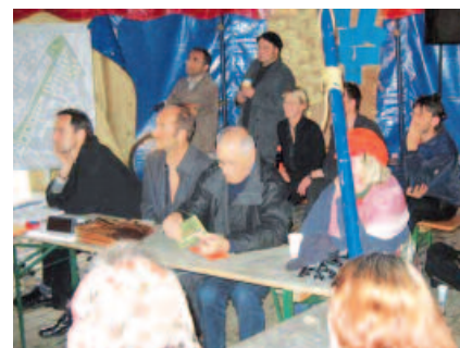
Mülheim plant – wir planen mit! SSM erprobt ein neues Planungsverfahren: 'Advocary Planning', eine Art Stadtplanung von unten; Bürgerbegehung auf dem Gelände des Güterbahnhofs.