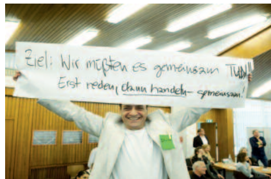
Zukunftswerkstatt 2011: Auch ein Jahr danach arbeiten die Akteure regelmäßig und aktiv in fünf Arbeitsgruppen.