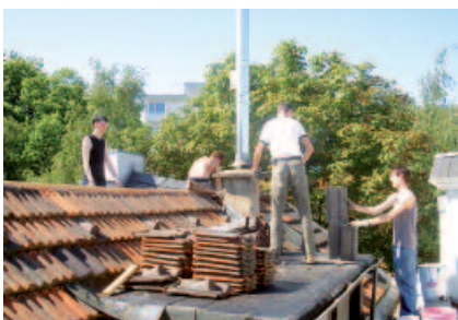
Dachreparatur in Eigenarbeit mit gebrauchten Dachziegeln.