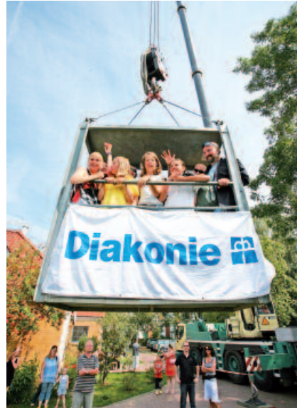
Träger des Projektes ist das Kreisdiakonische Werk Stralsund e.V.