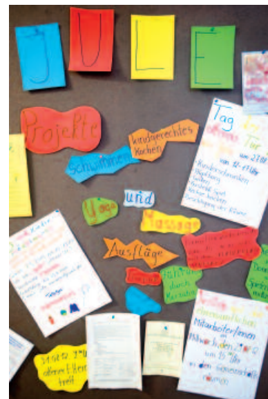
Vielfältige Angebote: gemeinsam mit den Kindern spielen, kochen, schwim- men oder Ausflüge machen. Es gibt auch Vorträge zu Themen wie: Haus- haltsbuch für knappe Kassen, Kinderer- ziehung oder gesunde Ernährung.