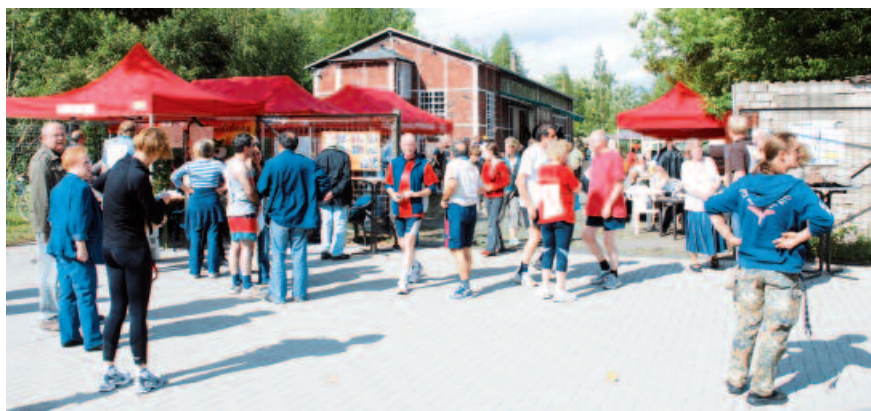
2007: SSM renoviert eine für den Abbruch vorgesehene Industriehalle. Heute steht sie unter Denkmalschutz und ist Möbellager.