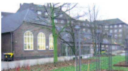
Der Betrieb der Halle finanziert sich aus erwirtschafteten Einnahmen und Teilverzicht der SAGA GWG auf Miete und Betriebskosten.