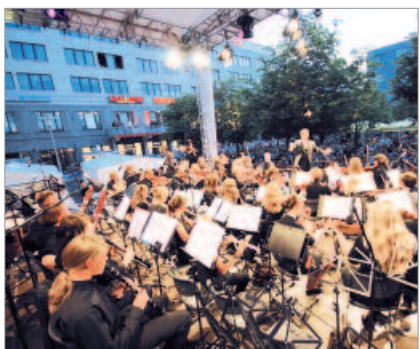
„Classic Open Air Helle Mitte“ auf dem zentralen Platz in Hellersdorf (6.000 Zuschauer, 2012)