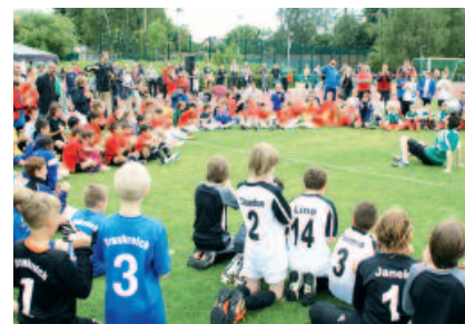
'Mini Fußball EM' mit dem Sportverein-Eintracht Mahlsdorf (2012)