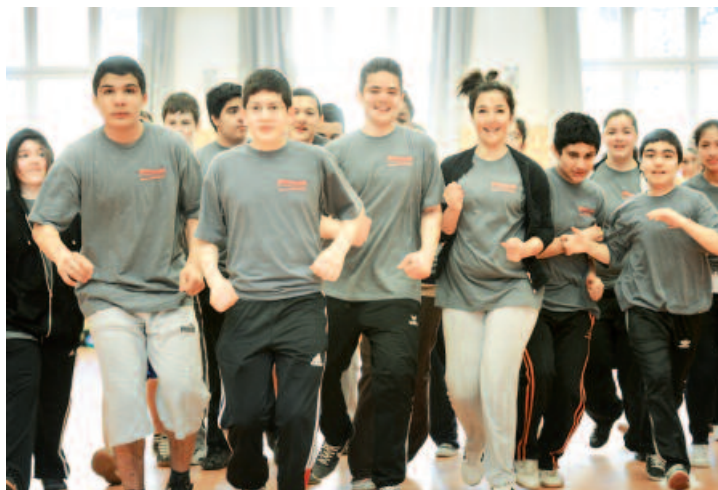
Seit August 2012 betreiben 40 SchülerInnen die Sporthalle verantwortlich.