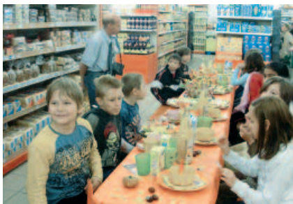
Der örtliche Marktleiter unterstützt das Projekt „Gesunde Kinderernährung“.