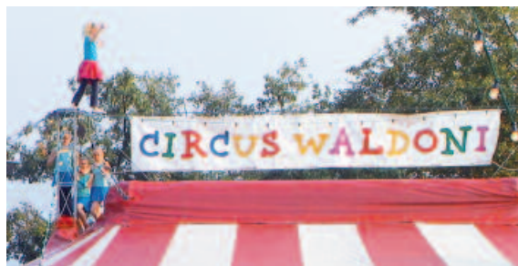
Zusammenführung von Bewegung, Kunst, Beratung und Qualifizierung