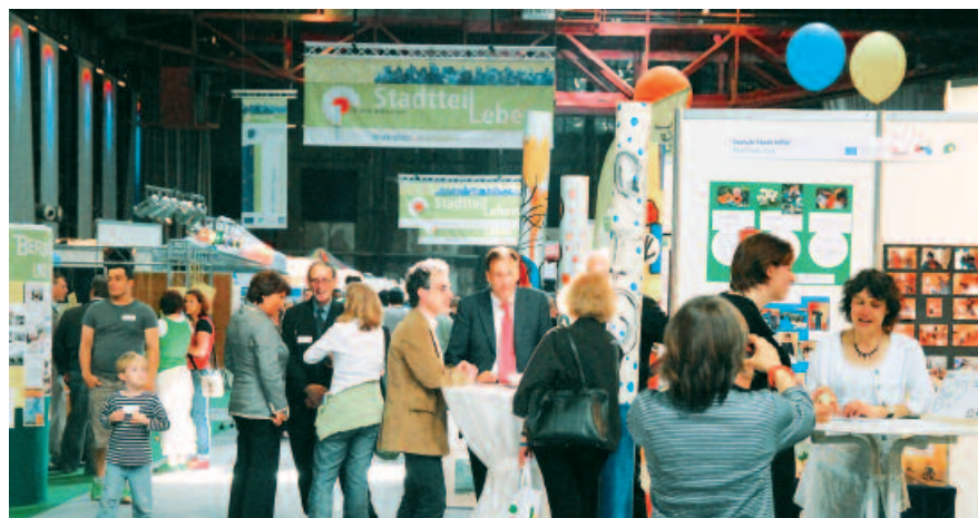
Fachkonferenz und Messe "StadtteilLeben-active cities in NRW and EU", 2011 in Duisburg

Wenn auch hochverschuldete nordrhein-westfälische Städte freiwillig Mitglied im Städtenetz werden, liegt es auf der Hand, dass das Städtenetz eine bundesweit einzigartige Arbeit leistet. Es trägt zur Verstärkung der Arbeit in den Städten bei, weil es durch die Beauftragung wissenschaftlicher Analysen wie auch durch die Erarbeitung von Standards zur Beschreibung der sozialen Lage in den Städten die Notwendigkeit kontinuierlicher Arbeit am Thema belegt. Von diesem Städtenetz geht die Botschaft aus: Die "Soziale Stadt" ist kein Feuerwehreinsatz in sozialen Brennpunkten, sondern eine Daueraufgabe ohne dauerhafte Lösung.