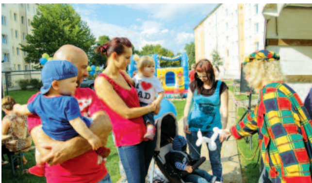
Der WIS mbH ist es gelungen ein familienfreundliches Wohnquartier zu schaffen.

Die WIS Wohnungsbaugesellschaft hat in den letzten Jahren das Wohnquartier SCHWEITZER ECK komplett umgestaltet. Da hier viele Familien und Alleinerziehende wohnen, geht das Unternehmen gezielt auf familiäre Bedürfnisse ein. Thematisch orientiert sich die Gestaltung der Fassaden und der Außen- und Spielanlagen am Namensgeber des Quartiers, Dr. Albert Schweitzer.