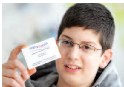
Die Schülerfirma besitzt auch Visitenkarten. Neben der Geschäftsführung gibt es derzeit die Abteilungen: Buchhaltung, Kunden-Service, Facility-Management und Öffentlichkeitsarbeit.