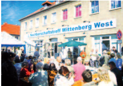
Eröffnung des Nachbarschaftstreffs (2010)