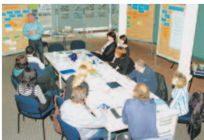
In ca. 7.000 Beratungsgesprächen wurden 1.200 Stadtteilbewohner erreicht und in ihrer Beschäftigungsfähigkeit gestärkt.