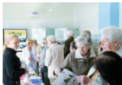
Bildungsmesse: Kreisvolkshochschule und andere Bildungsträger stellen ihre Angebote vor.