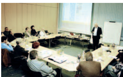
„Virtuelles Unternehmerkolleg“ (2006)