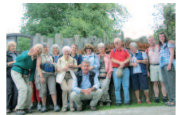
Wandergruppe des Vereins: Jeden zweiten Donnerstag im Monat werden Wanderungen organisiert.