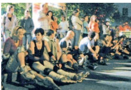
„Skate by Night“ mit Zwischenstopp in Hellersdorf (2012)