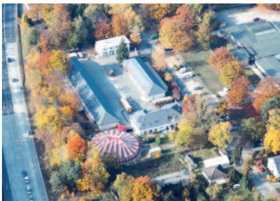
'Creativhof Grenzallee' – innovativer Ort des Wissens mit Circuszelt, Trainingshalle, Kunstwerkstatt (oben), Sozialarbeiterhaus (im Vordergrund) und Qualifizierungsstätten (langes Gebäude links), in alten Zirkuswagen Büro, Café und Aufenthaltsraum.