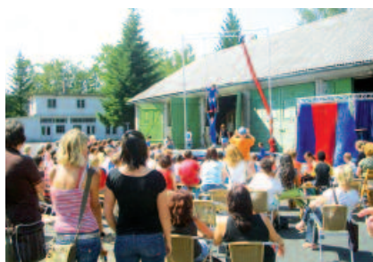
Auftritt im Creativhof