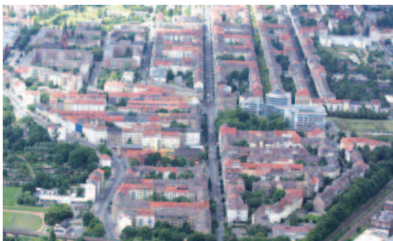
Leipzig Osten mit der zentralen Eisenbahnstraße