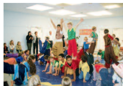
Auftritt Projekt „Drogen- und Gewaltprävention“