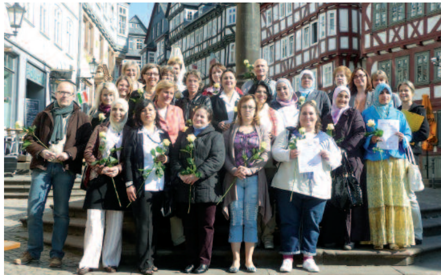
Feierliche Übergabe der Zertifikate im Rathaus von Marburg (2011)

Mit dem Projekt ist im Stadtteil ein gut ausgebautes Netzwerk entstanden. Die vorhandenen Strukturen werden genutzt und ausgebaut. Die Synergien, die durch die Vernetzung entstehen – und hier seien auch besonders die Verbesserung der Wohnzufriedenheit im eigenen Umfeld sowie der generationenübergreifende Charakter anerkennend und vorbildlich hervorgehoben – sind beispielgebend für zahlreiche andere Wohnquartiere. Helfende Hände in vielerlei Hinsicht!