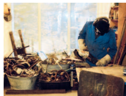
Praxistag im Bereich Bildhauerwerkstatt, Schrottkunst