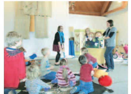
Alle Räume sind multifunktional und mehrfach genutzt. Kinder und Jugendliche erleben das Haus als erweitertes Kinderzimmer.