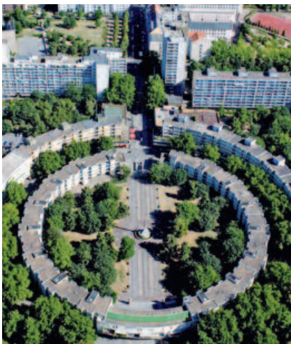
Mehringplatz (Hans Scharoun, Werner Düttmann)