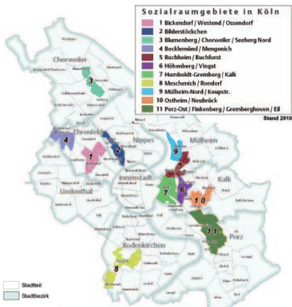
Einrichtung von 11 Koordinationsstellen