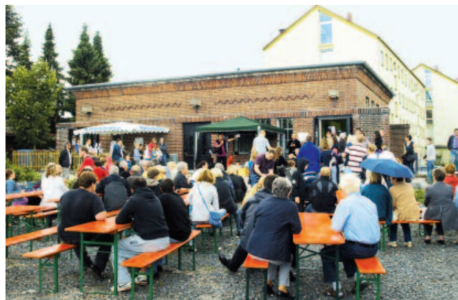
Das Trafohaus wurde denkmalgerecht umgebaut und energetisch modernisiert.