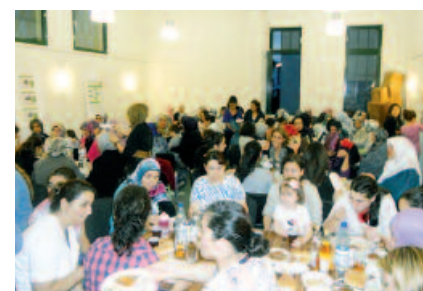
Fastenmahl Ramadan 2011 mit vielen Gästen verschiedener Kulturen