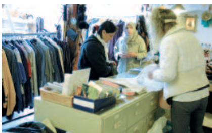
Kleiderladen des SSM: Im Second-Hand-Laden können die Mülheimer Bürger günstig einkaufen.