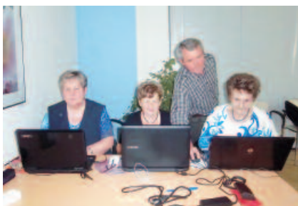
Computerkurs für Senioren