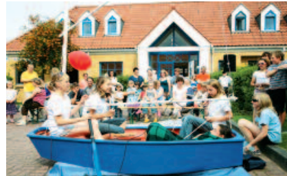
Sommerfest im Nachbarschaftszentrum