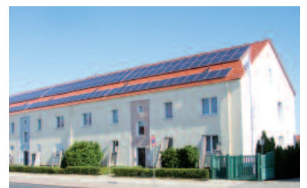
Beispielhaftes Zusammenspiel von energetischer Sanierung, Berücksichtigung des demografischen Wandels und vielfältiger Gemeinwesenarbeit