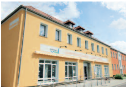
Der Nachbarschaftstreff mit einem Angebotsspektrum für Senioren, Kinder und junge Familien (nach der Fassadensanierung)