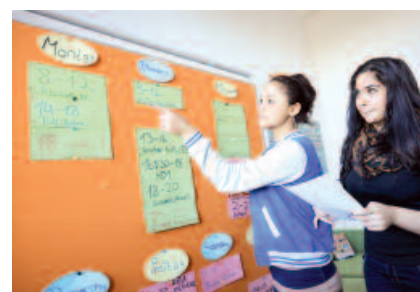
Erarbeitung des Hallenbelegungsplanes