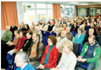
Auf Stadtteil- und Bürgerkonferenzen wird die Ressourcen-, Problem- und Bedarfslage diskutiert.