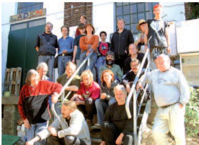
'Sozialistische Selbsthilfe Mülheim' – ein wirtschaftlich eigenständiger Selbsthilfe-Integrationsbetrieb mit langjährigem stadtteilpolitischen Engagement.