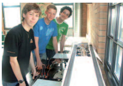
Franz-Carl-Achard-Preis: Für drei Jugendprojekte gab es den Sonderpreis "Wissen und Wissenschaft in der Schule" (2007)