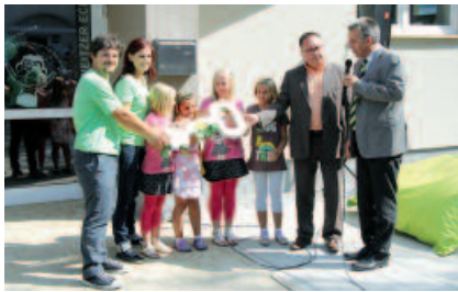
Eröffnung des Kindertreffs