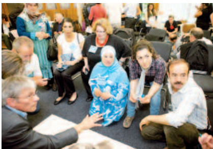
Bewohner im Dialog mit Vertretern der Verwaltung und der Wohnungswirtschaft

Solidarische Nachbarschaften, in denen die Menschen Verantwortung füreinander und für die Zukunft ihres Stadtteils übernehmen, sind das Fundament einer sozialen Stadt. Aber wie gelingt es, Interesse an einem solchen Miteinander zu wecken, neben den täglichen Aufgaben und Pflichten die Basis für Engagement zu ermöglichen?