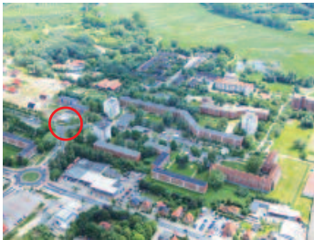
Das Altländer Viertel

Großsiedlung, 1960er Jahre, Punkthochhäuser, Zeilenhäuser mit drei bis sieben Geschossen, 1.800 Einwohner