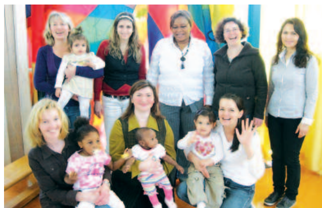
Projekt "Sprich mit mir"

Menschen mit Migrationshintergrund sind als Experten ihrer selbst einbezogen. Sie sind die Brückenbauer und Vermittler in viele unterschiedliche Migranten-Communities, wenn es um frühe Sprachförderung und Erziehungskompetenz geht. Zugleich gewährleisten sie mit ihrem ehrenamtlichen Engagement und ihren Beziehungen zu den Menschen ins Quartier die Nachhaltigkeit und die Verbreiterung der Arbeit. Prävention und Empowerment gelingt, wenn es wie hier in Hof von einem auf Erweiterung setzenden Netzwerk unterschiedlicher Akteure getragen wird.