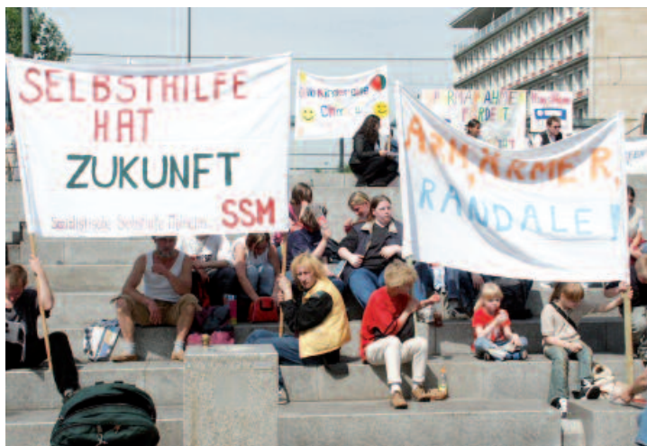
2006: Demonstration in Köln-Mülheim gegen Kürzungen im sozialen Bereich.