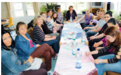
KNIF Info-Veranstaltung zum Thema Medien

Ein Knoten ist Sinnbild für eine feste Verbindung von Fäden. Dieses Bild hat engagierte Akteure zweier sozialer Einrichtungen zu diesem Projekt inspiriert. Eltern und ihren Kindern sollen Bildungschancen und gesellschaftliche Teilhabe ermöglicht werden.