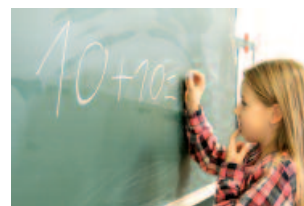
Lernen im Kindertreff