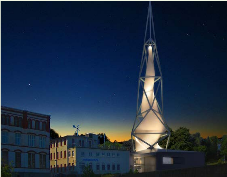
PHÄNOMENTA-Neubau, Lüdenscheid (© KKW Architekten, Altena)