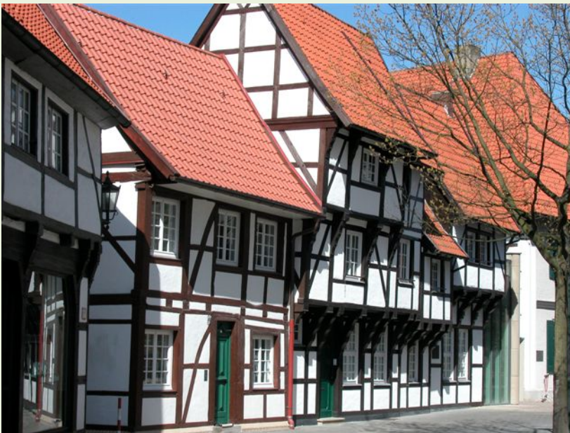
Werne an der Lippe