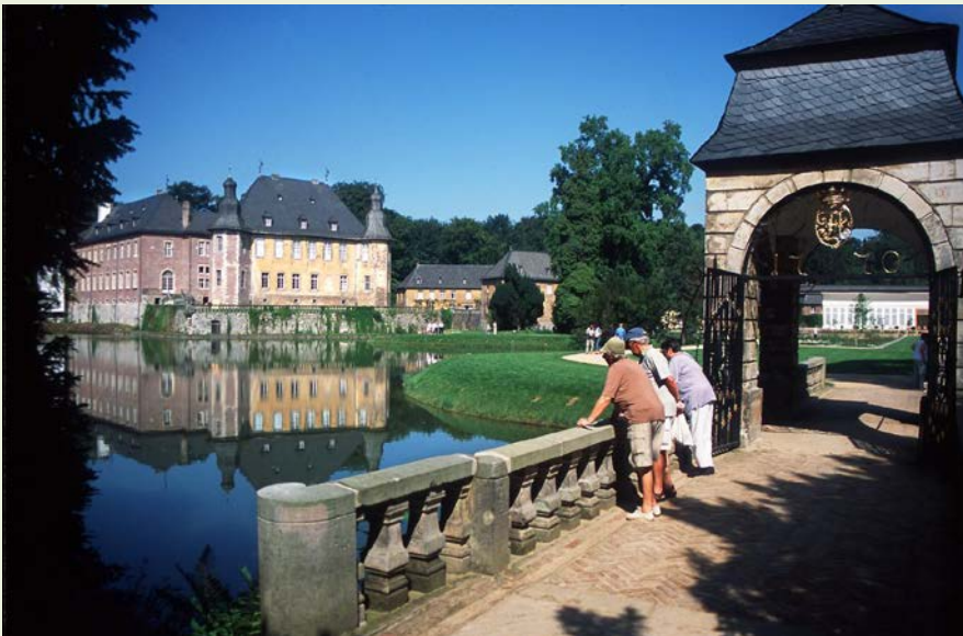
Schloss Dyck, Kreis Neuss