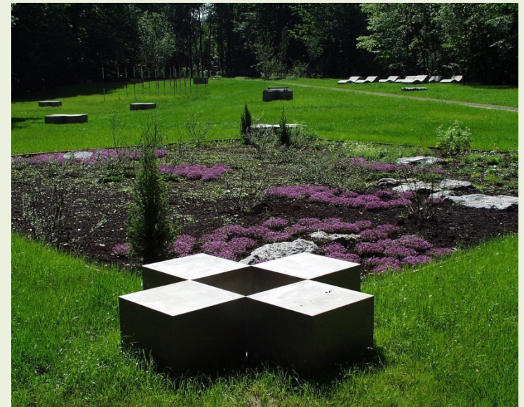
Fundstelle im Neanderthal Museum, Mettmann